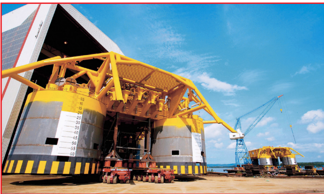
Ormen Lange processing facility, Nyhamna