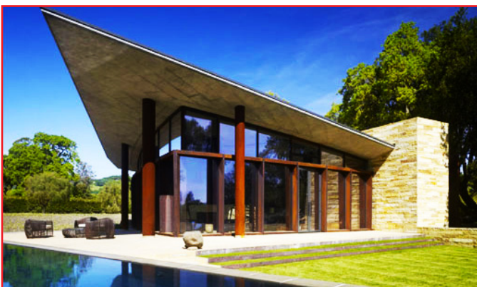
ZEN SPA, Ramskog