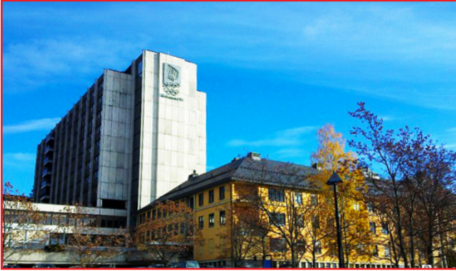
Lillehammer Sykehus, Lillehammer