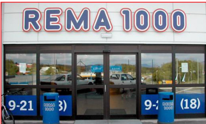
REMA 1000, Bærum