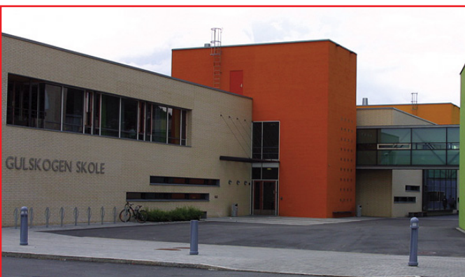
Gullskogen Skole, Drammen